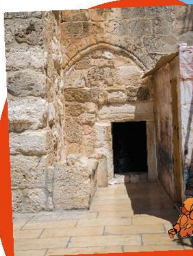
Vstup do baziliky Narození