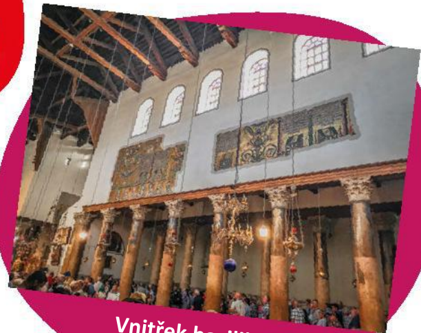
Vnitřek baziliky Narození